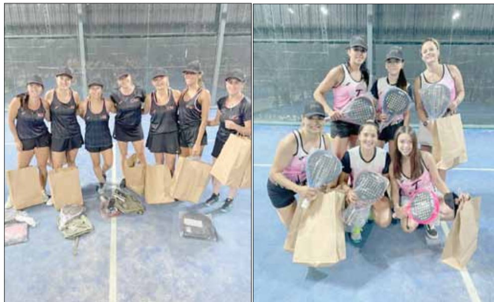
“Calzonetta” y “Sportime”, los encargados de definir el campeón.

Cabe señalarse que FEJUBA representa una rama diferente a la de FAP (Federación Argentina de Pádel). Dentro de ésta última, el año pasado, se disputó una fecha del provincial de Libres y una fecha del provincial de Veteranos en las canchas de nuestra ciudad.