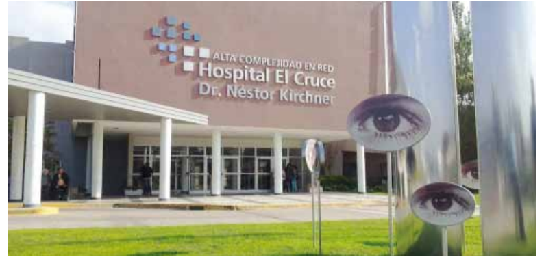
El Cruce. Uno de los hospitales que se privatizaría.

Cuatro están en el Conurbano y uno en el interior. Aplicarían un modelo de gestión tercerizada, con pago de cápitás.