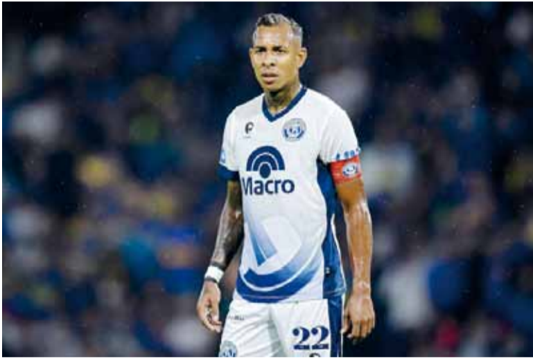
Revés. El delantero se aleja del Monumental.