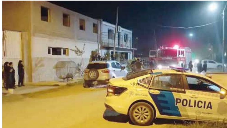
Horror. El siniestro se inició alrededor de las 21.30 del lunes en las calles 110 y 25 de Mayo.