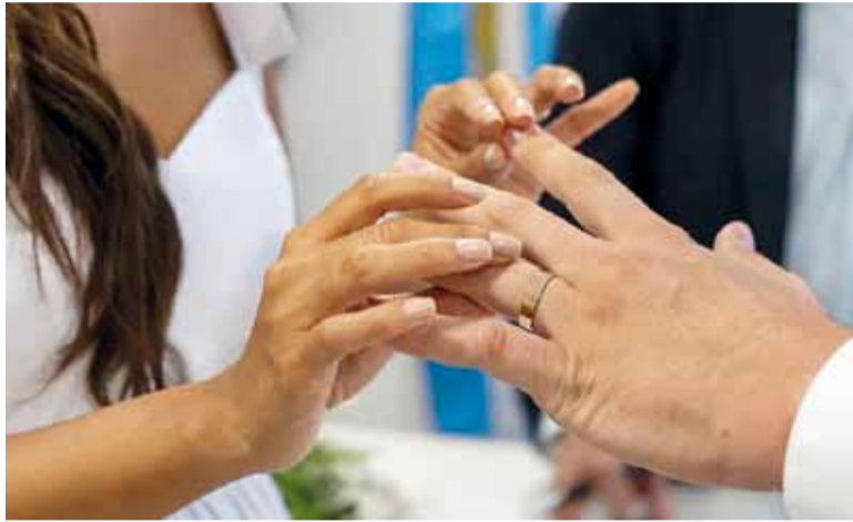
Con anillos. Dos personas dan el “sí” en la ceremonia del casamiento.

Pero ese descenso en los casamientos a nivel provincia de Buenos Aires se repite en todo el país, ya que en la actualidad se celebran menos de la mitad que en 1980. No obstante, sí hay un crecimiento y tiene que ver con las uniones convivenciales. Se pasó de 34.969