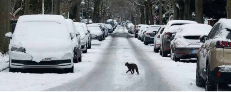
Postal. París, de blanco.

Las bajas temperaturas provocaron caos ayer por segundo día consecutivo, en particular en Francia.