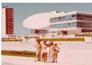
El Casino en su esplendor.