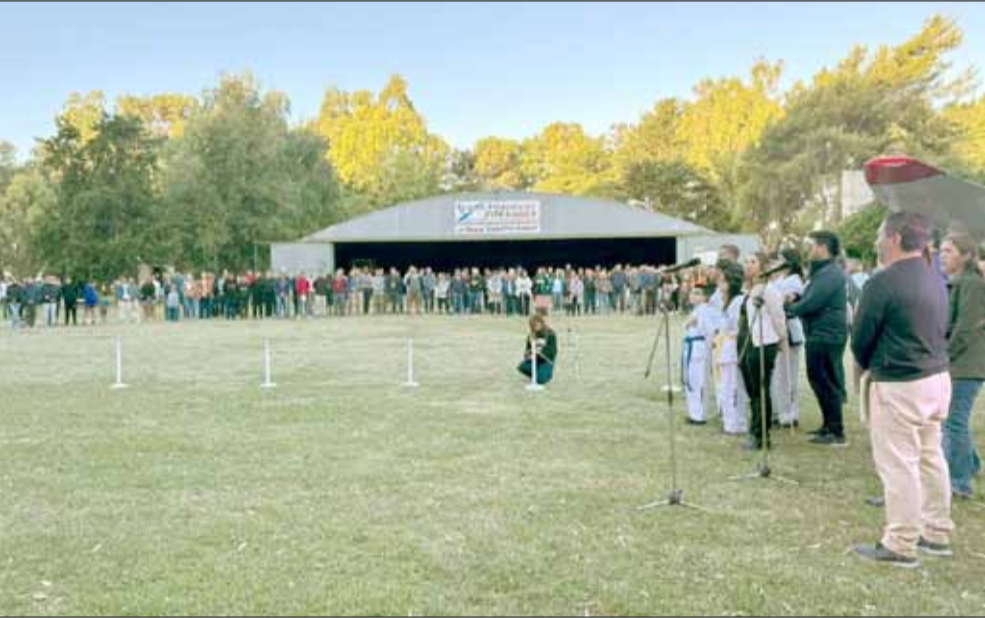
Aspecto de la ceremonia de apertura oficial de este Campeonato Nacional.

El plantel comenzará con sus entrenamientos el miércoles 21 de este mes.