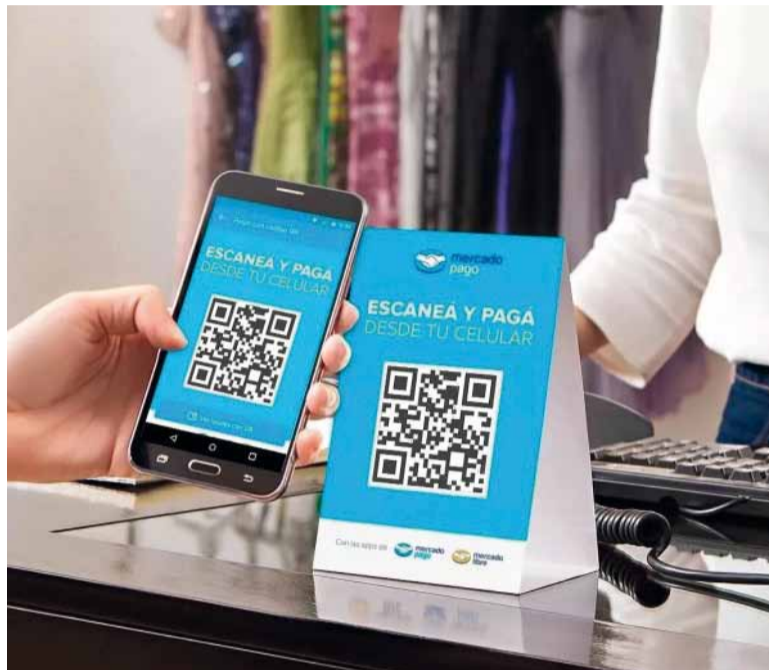
Cambio. La decisión modifica el esquema tributario que se había proyectado para los primeros meses de 2026.

Entre las plataformas alcanzadas por la medida que finalmente no se tomó se encontraban Mercado Pago, App YPF, Prex, Carrefour Banco, Shell Box, Claro Pay y otras aplicaciones que operan