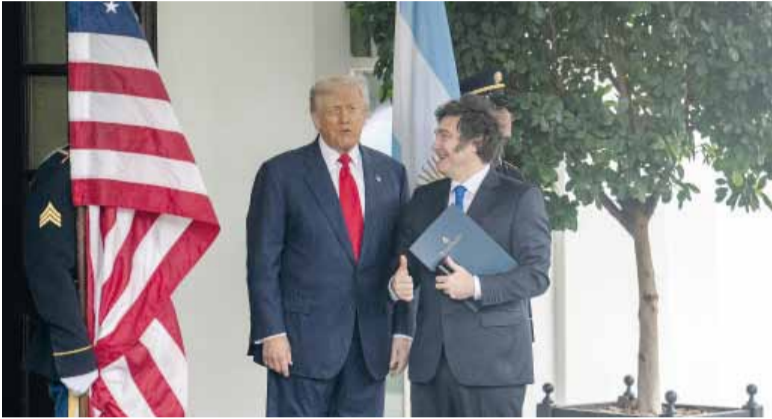
Aliados. Javier Milei, el año pasado, en uno de sus encuentros con Trump.

"Argentina valora la decisión y determinación demostrada por el presidente de Estados Unidos y por su gobierno en las recientes acciones adoptadas en Venezuela, que derivaron en la captura del dictador Nicolás Maduro, también líder del Cartel de los Soles, que al igual que el Tren de Ara-