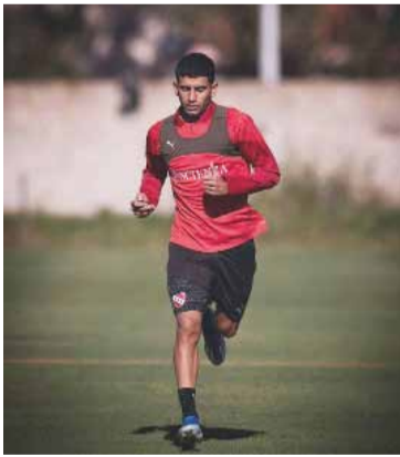
Castigado. Ruiz continuará con los trabajos en Villa Domínico.

En medio de este tire y afloje entre dirigentes y entorno del ju-