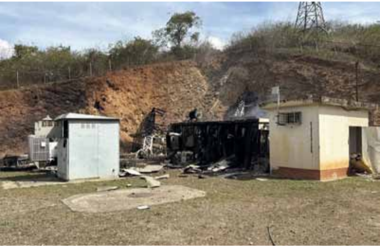
El ataque. Al menos 56 efectivos murieron en la incursión norteamericana en Caracas, según fuentes locales.

Al menos 24 oficiales venezolanos murieron durante la operación militar estadounidense para capturar al presidente Nicolás Maduro y llevarlo a Nueva York para enfrentar cargos federales de narcotráfico, informaron ayer las autoridades venezolanas, con lo que se eleva a 56 el número de efectivos fallecidos en la incursión norteamericana en Caracas, al sumarse los 32 informados el lunes por Cuba. El ejército venezolano publicó en las redes sociales un video de homenaje a los soldados muertos. El tributo mostró un montaje en forma de corazón formado por